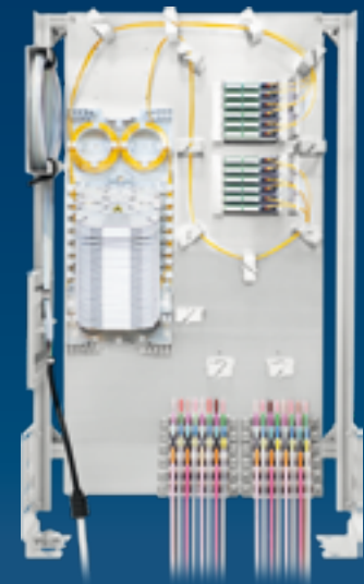
(Darstellung mit Montagerahmen) (shown with mounting frame)